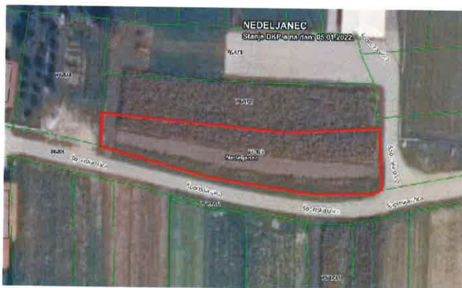
Slika 2. - položaj i oblik - prikaz iz Geoportal preglednika