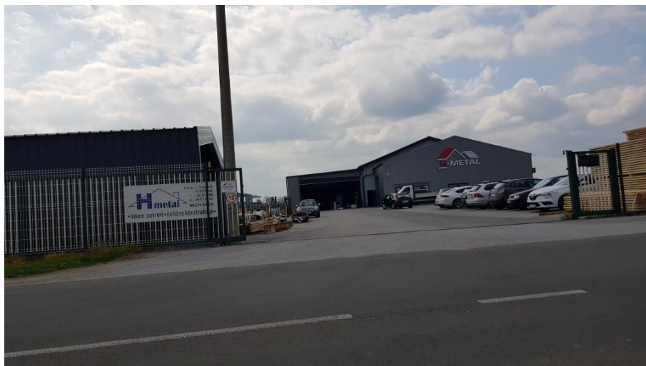
Prikaz 6 Poslovna zona u južnom dijelu naselja Krkanec, planira se proširenje zone prema naselju, tj sjeverno od izvedenog dijela.

Ukupno građevinsko područje naselja na općinskom području smanjeno je za 12,3092 ha.