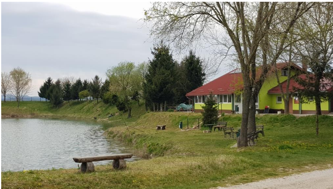
Prikaz 10 IGPIN Rekreacijska zona uz ribnjak u Šijancu

Područje je uređeno, unutar njega je izveden ugostiteljski objekt i uređeno dječje igralište i klupe za sjedenje. Područje se najviše koristi za sportski ribolov.