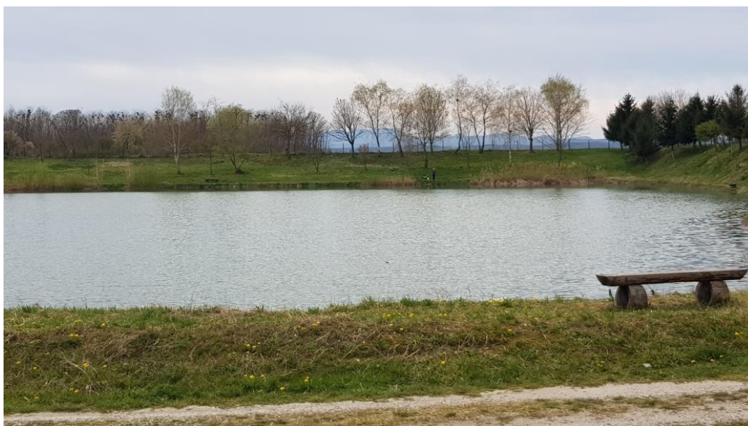
Prikaz 20 Rekreacijski ribnjak u Šijancu

Sve vodene površine koje se koriste za bilo kakvu gospodarsku, sportsku i/ili rekreacijsku aktivnost, radi mogućeg negativnog utjecaja na ciljne vrste, ciljna staništa i ekološku mrežu, bez obzira na lokaciju, način izvedbe i veličinu zahvata, podliježe ispitivanju utjecaja zahvata na okoliš i prirodu.