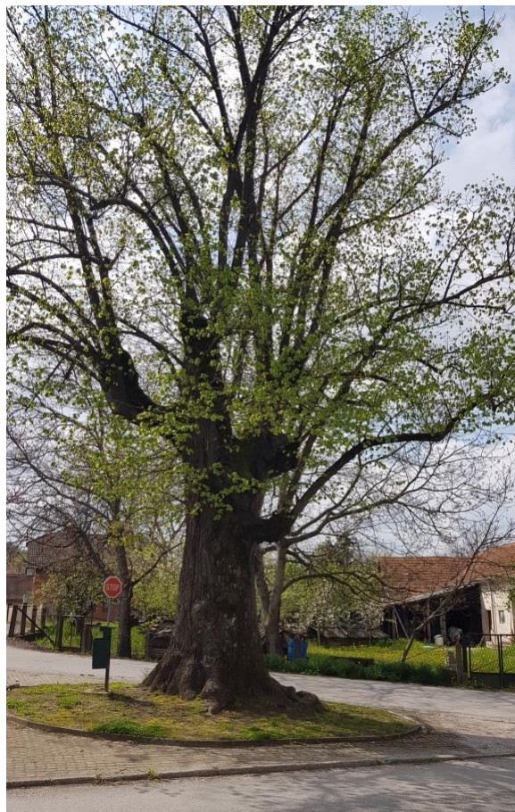
Prikaz 13 Crkva sv. Antuna, Tužno, Z-4549 i stablo ispred nje (južno)

Predlaže se granice KD Crkva sv. Antuna, Tužno, Z-4549 proširiti na način da obuhvati raskrižje sa starim stablom.