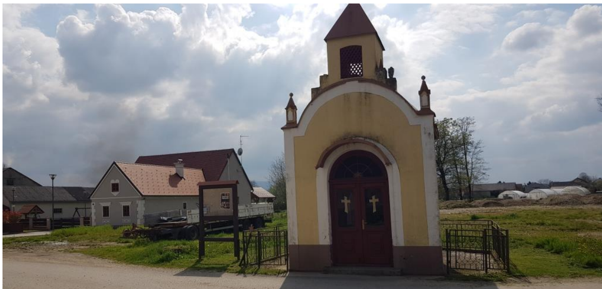
Prikaz 18 Etno kuća (KITEC) i kapelica Uzvišenja sv. Križa, u Domitrovcu