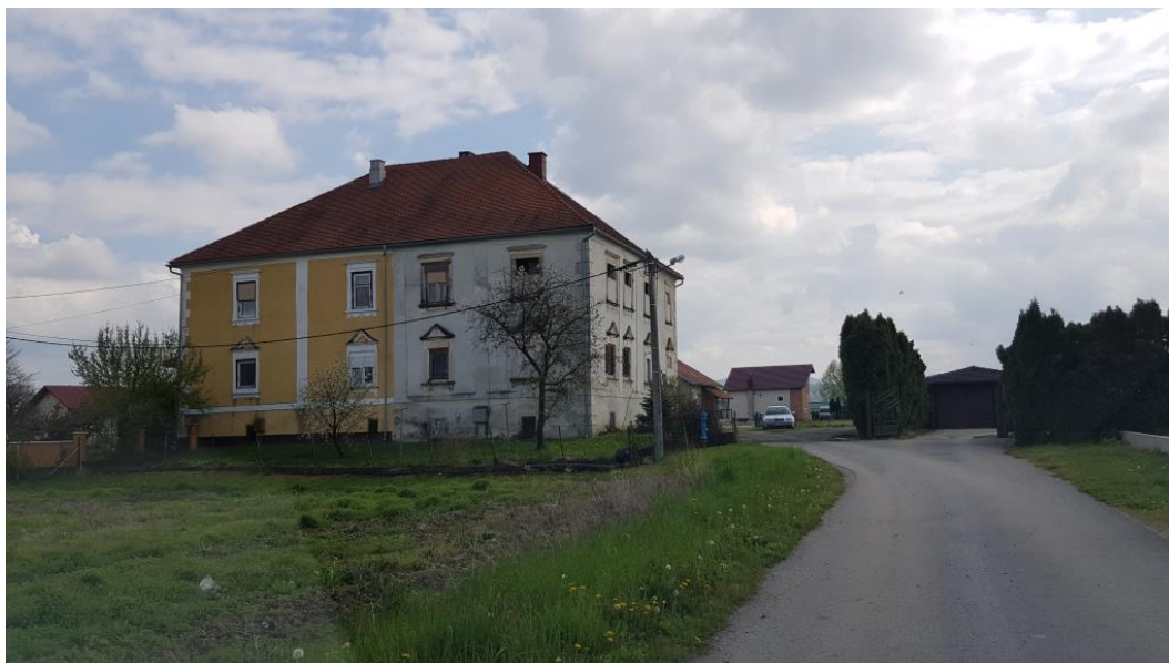
Prikaz 16 Dvorac Patačić u Krkancu, Z-2277