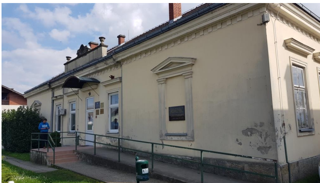
Prikaz 19 Ambulanta u Vidovcu

Radi izbjegavanja mogućeg negativnog vizualnog utjecaja na pojedino nepokretno kulturno dobro, stručno mišljenje nadležnog Konzervatorskog odjela potrebno je tražiti i u slučajevima planiranja građevinskih zahvata i na česticama u neposrednom kontaktnom prostoru udaljenosti do 30,0 m od registriranog i evidentiranog kulturnog dobra, kao i kod utvrđivanja lokacija za postavu samostojećih antenskih stupova na cijelom području Općine.