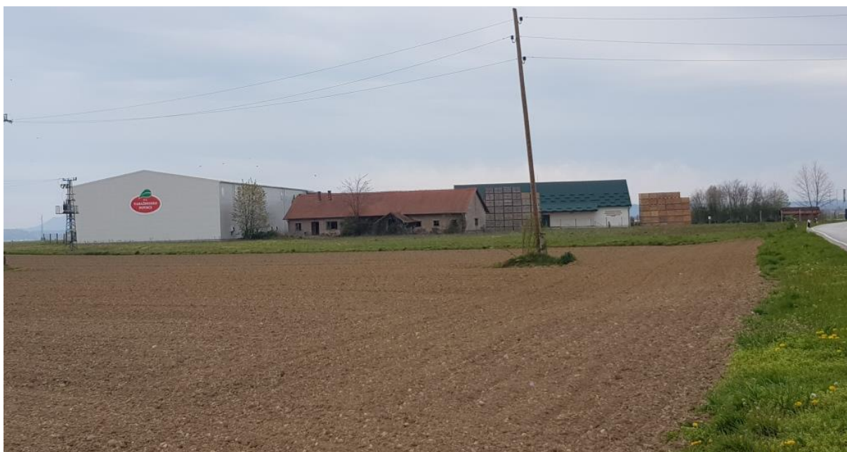
Prikaz 9 Izgrađeni dio Gospodarske zone u Cargovcu – hladnjača za povrće

Unutar zone je izgrađen otkupno – distributivni centar za povrće s hladnjačom – PZ Varaždinsko povrće. Uz centar, unutar zone za sada funkcionira samo još jedna djelatnost – uzgoj i prodaja božićnih jelki. Ostatak zone je za sada neizgrađen, a zemljište se koristi za poljoprivrednu obradu.