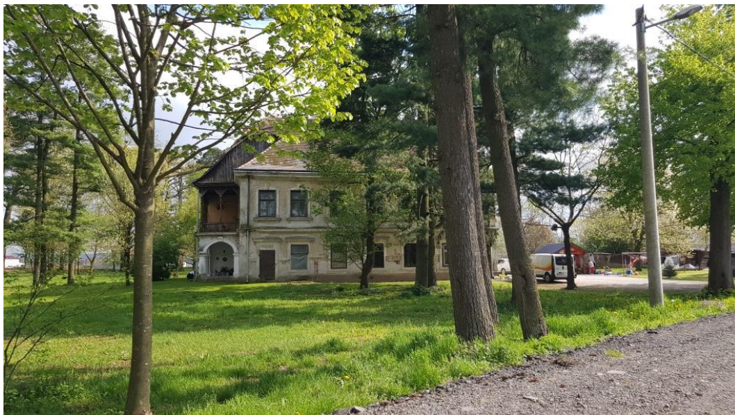
Prikaz 14 Dvorac Jordis – Lohausen u Vidovcu, Z-1581