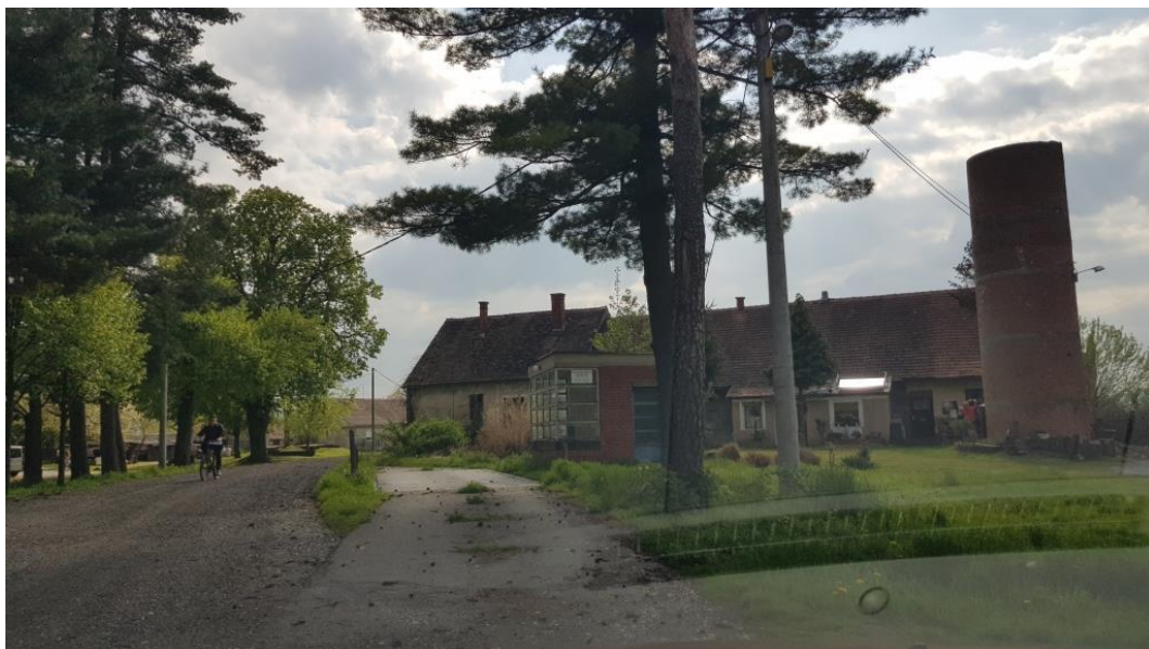
Prikaz 15 Gospodarski kompleks u obuhvatu granica KD Z-1581