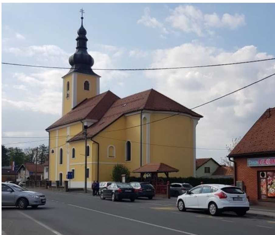
Prikaz 12 Crkva sv. Vida u Vidovcu, Z-1580

Za neposredni nadzor provedbe mjera zaštite kulturno – povijesnih vrijednosti na području Općine nadležno je Ministarstvo kulture i medija, Uprava za zaštitu kulturne baštine, Konzervatorski odjel u Varaždinu, u daljnjem tekstu nadležni Konzervatorski odjel.